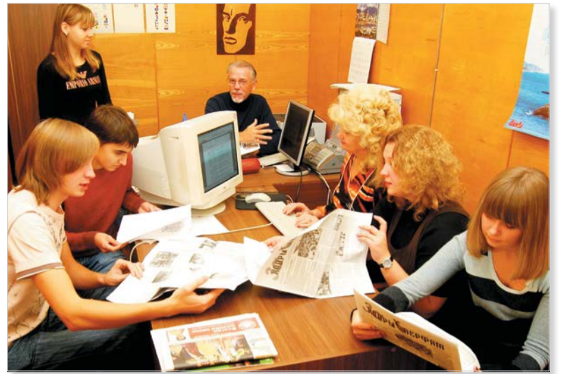
У редактора «ЗКВ» никогда не было недостатка в добровольных помощниках из числа студентов и сотрудников (фото 2006 года)

дакционно-типографскому процессу. В первой части главы рассказывается, как производилась правка и редактирование рукописных оригиналов; как работали ответственные за связь с «ЗКВ» (по линии бюро ВЛКСМ и партбюро подразделений) на факультетах и в отделах. Во второй части мы как бы побываем в типографии им. В. Володарского Лениздата в разные периоды и узнаем, что такое горячий набор, фотонабор, компьютерный набор, офсетная печать.