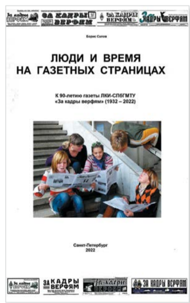
критиками нашей газеты.

– В первой главе – история многотиражной печати в СССР, и в частности вузовской многотиражной газеты «ЗКВ». В конце главы в качестве «ликбеза» для широкого читателя приводится краткий словарь газетных терминов – что