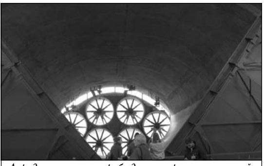
Аэродинамическая труба для натурных испытаний

ONERA была основана в 1946 году и предназначалась для создания авиации страны. Основным направлением деятельности изначально являлись исследования в области аэродинамики, испытания авиационных двигателей, материалов и конструкций. Позже лаборатория начала заниматься развитием сверхзвуковых самолетов, внося также вклад в конструкцию первых ракет-носителей, спутников и баллистических ракет. Сейчас ONERA использует новейшие технические средства исследования, занимается гражданскими и военными проекта-