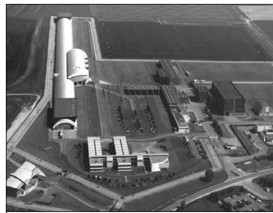
Панорама комплекса Гидродинамических лабораторий

Делегация корабелов побывала в городке Val-de-Reuil, где нам представили один из крупнейших опытовых бассейнов Франции. Здесь нас предупредили, что эта организация закрытого типа, поэтому пропуска выдавали под залог паспортов. На входе к группе были приставлены двое жандармов, которые сопровождали нас вплоть до выхода с рабочей территории комплекса.