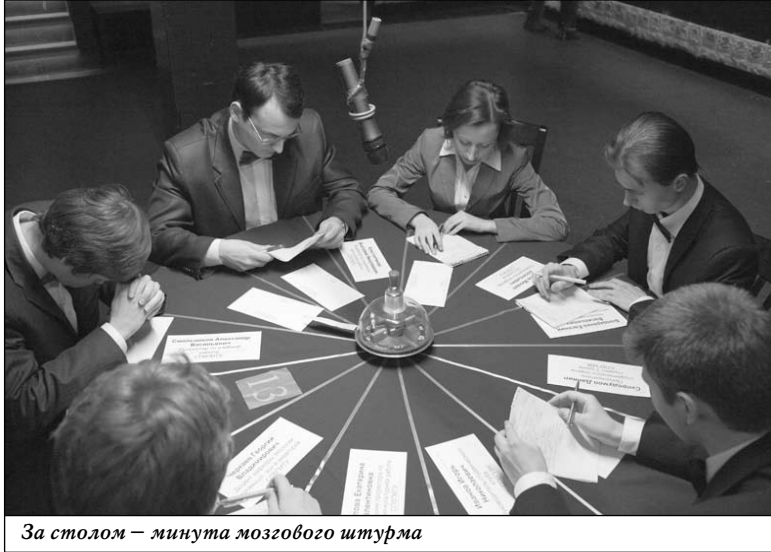
За столом – минута мозгового штурма