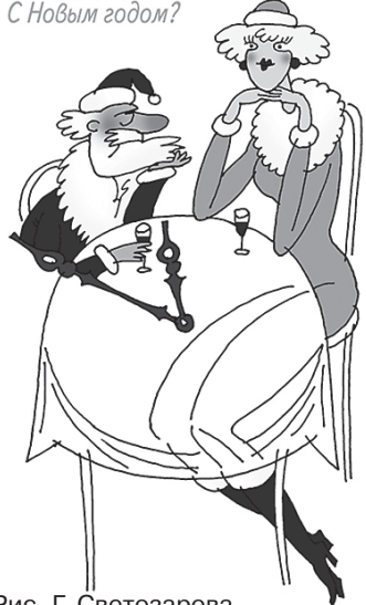
Рис. Г. Светозарова