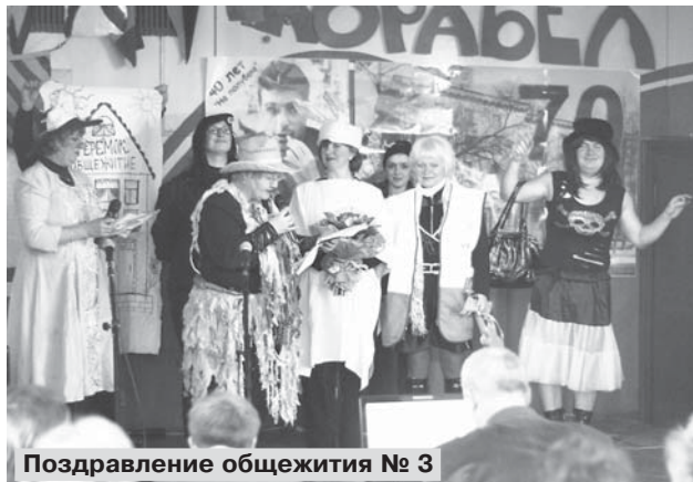
Поздравление общежития № 3