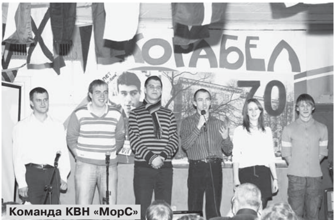
Команда КВН «МорС»

Однако, хочется верить, что сегодняшние студенты активно примут участие в капитальном ремонте здания общежития и возьмутся за организацию своего студенческого быта. Корабелы должны вернуть себе утраченные позиции. Наш лозунг всегда