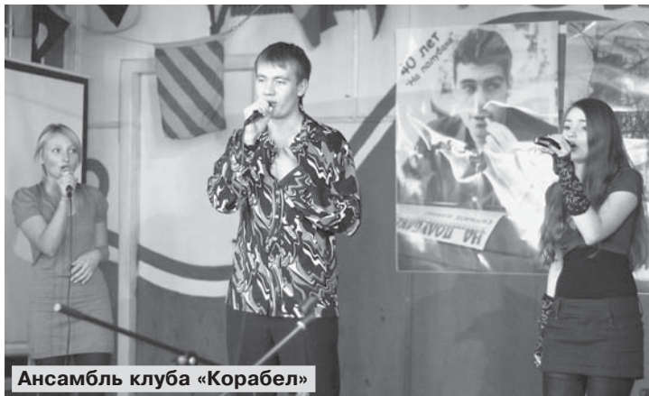
Ансамбль клуба «Корабел»