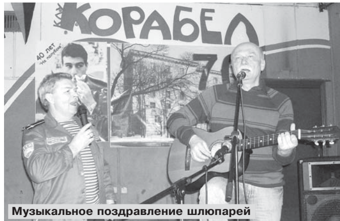
Музыкальное поздравление шлюпарей