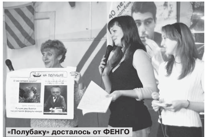
«Полубаке» досталось от ФЕНГО